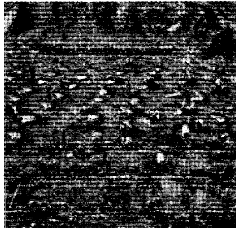
Λεκάνες πού ἔχουν σχῆμα ἡμισέληνον ἐμποδίζουν τὴν διάβρωση τοῦ ἐδάφους καὶ συγκρατοῦν τὸ νερὸ τῆς βροχῆς τὸ χειμῶνα καὶ μποροῦν νὰ χρησιμοποιηθοῦν γιὰ πόσιμα τὸ καλοκαίρι (Σχολικὸ Δάσος Κυθρέας).