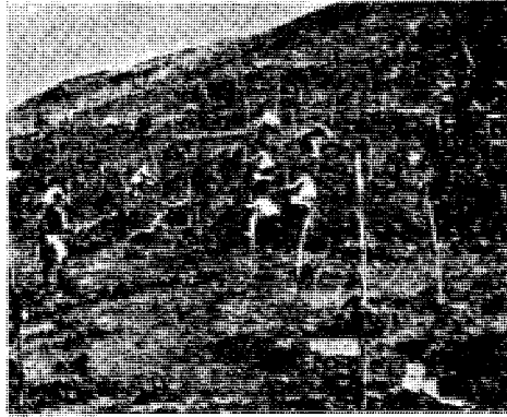
Μαθητές τοῦ Σχολείου Κυθρέας ἐργαζόμενοι εἰς τὸ Σχολικὸ τοῦς Δάσος.