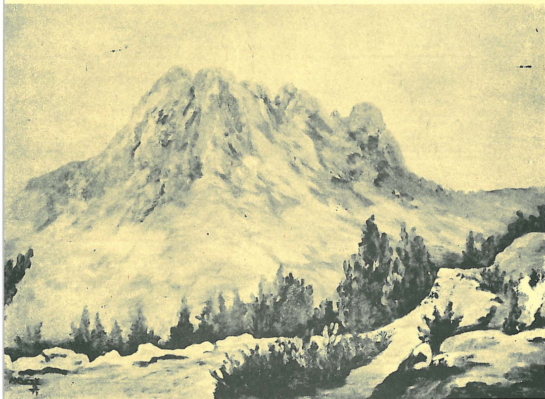
Έργον κ. Μαρούλας Χρίστου