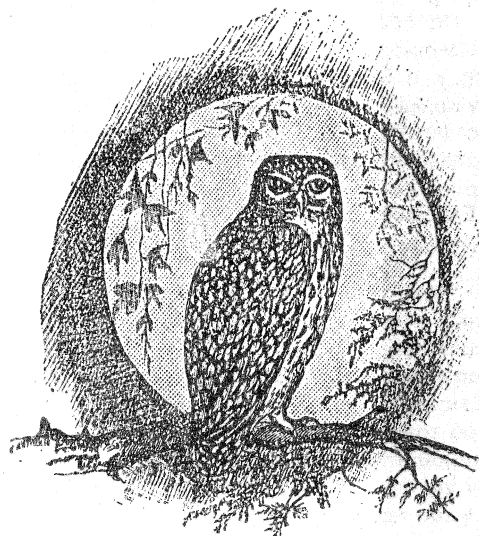
Η κουκουβάγια σε ειρηνική στάση κερδίζει όλο τον κόσμο.

σου. Τέτοιο είναι και το έργο που θα περιγράψω σήμερα και που το ζωγράφισε ο Ι.Ν. Ιωαννίδης πριν από 70 τόσα χρόνια.