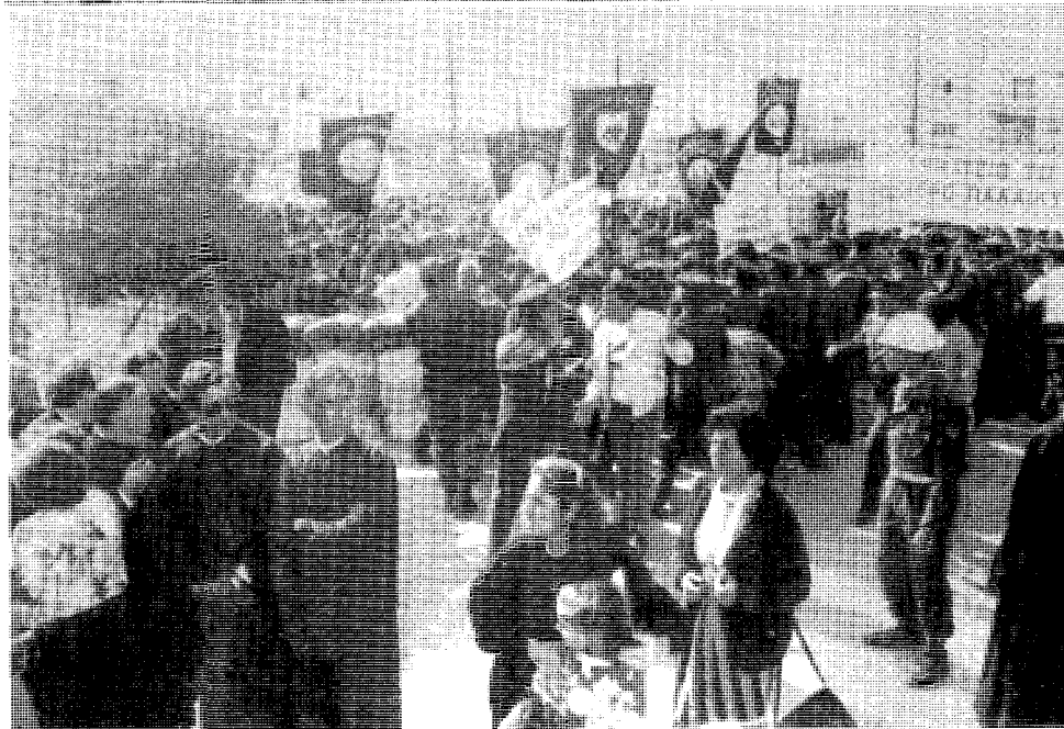
Από την πορεία προς την περιοχή Μια Μηλιάς - Κυθρέας που έγινε στις 3 Νοεμβρίου 1991.