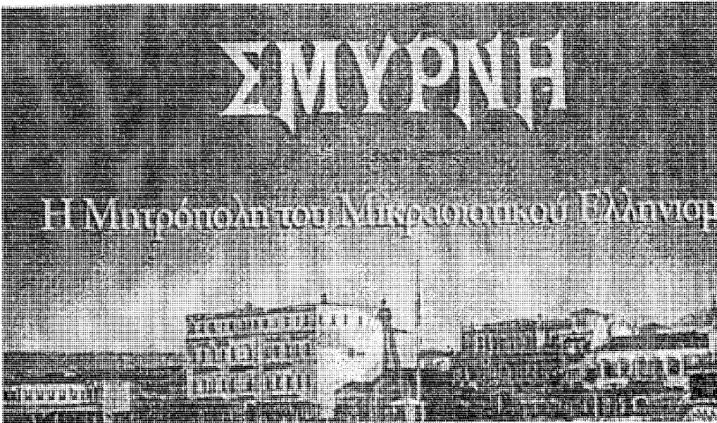
ΣΜΥΡΝΗ: Η Μητρόπολη του Μικρασιατικού Ελληνισμού

μέλος. Εισαγγελέας ορίστηκε κάποιος Μαζχιάρ. Η δίκη διήρκεσε 5 λεπτά και η ποινή: Θάνατος. Ως τόπος εκτέλεσης ορίστηκε το Τιρκιλίκι αλλά ο εξαγριωμένος όχλος τον απήγαγε και τον κατακρεούργησε.