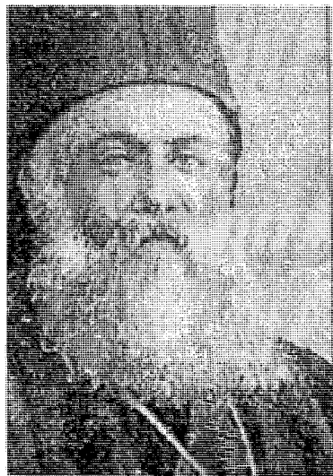
Ο Σμύρνης Χρυσόστομος

Συγκεκριμένες είναι οι πληροφορίες για τις τελευταίες ώρες του Χρυσόστομου. Γάλλος ναύτης που παρακολούθησε από απόσταση τη διαπό-