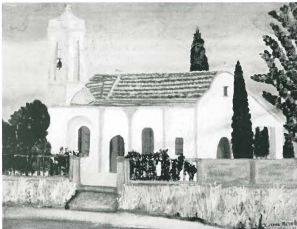
Ιερός Ναός Τιμίου Σταυρού Χρυσίδας Φωτογραφία από πίνακα της κ. Κατίνας Χρ. Πέτσα