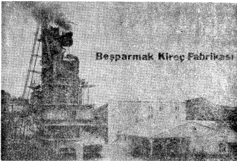
Έργοστάσιον Έταιρείας Άσβεστοποιίας Συρκανιάς.

της Κυθρέας βγήκαν αληθινές, ότι οι Τούρκοι δέν είναι δυνατό ν' αφήσουν άνεκμετάλλευτες τις έτοιμες και ολοκληρωμένες, τις εύχρηστες και έπικερδείς βιομηχανίες άσβέστου και σκυροποιίας, όχι μόνο της Κυθρέας αλλά και όλων τών άλλων περιοχών, που έχουν κάτω από την παράνομη και άδικη κατοχή των. Τις κατέλαβαν όμως δια της στρατιωτικής των έπιχειρήσεως, με τò πύρ και τò σίδερο, με την άρπαγή και την λεηλασία. Δέν τις έχουν κερδίσει με μόχθο και αίμα γι' αυτό δέν τους ανήκουν και ή κατοχή και έκμετάλλευσή τους θά είναι προσωρινή και παροδική. Σίγουρα θά έλθει καιρός που θά περιέλθουν στους νόμιμους ιδιοκτήτες τους. Στους Έλληνες, σ' αυτούς που έκαμαν τις νύχτες μέρες να τις κερδίσουν. Σ' αυτούς που μόχθησαν όχι μονάχα οι ίδιοι, αλλά και οι γενιές τών προγόνων τους.