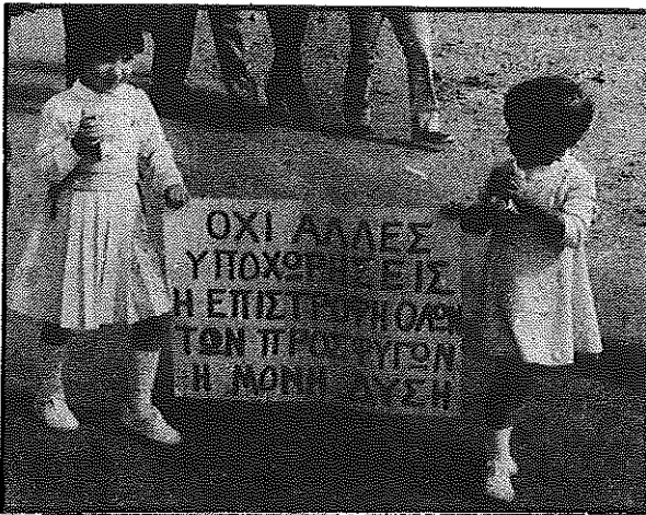
ΠΟΡΕΙΑ ΠΡΟΣ ΤΗΝ ΚΥΘΡΕΑ

Το Προσφυγικό Σωματείο Αθλητική Ένωση Κυθρέας, καλεί μαζικά όλα τα μέλη του να δώσουν το παρόν τους στην πορεία που θα γίνει στις 23 Οκτωβρίου, ημέρα Κυριακή και ώρα 9.30 π.μ.