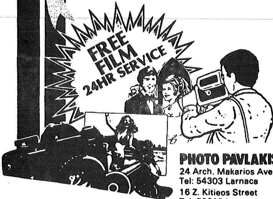
PHOTO PAVLAKIS 24 Arch. Makarios Ave. Tel: 54303 Larnaca 16 Z. Kitieos Street Tel: 52623 Larnaca