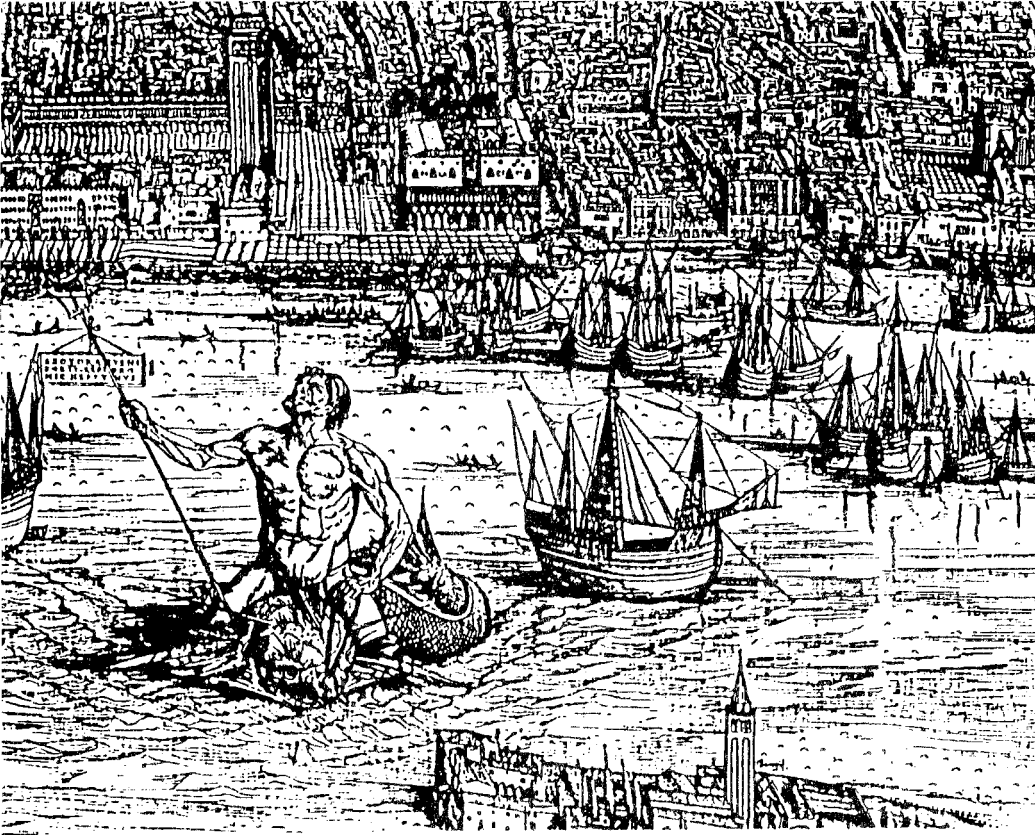
Η εκκλησία του Αγίου Μάρκου, το καλάτι του δόγη και ο θεός της θάλασσας Ποσειδώνας.

εμπόριο των σιτηρών και του αλατιού ως κρατικό μονοπώλιο, η Κύπρος ως τόπος εξορίας Βενετών καταδίκων και ο εκτοπισμός των παιδιών του Ιακώβου Β' στην Πάδοβα. Με την προσέγγιση αυτή, το πλούσιο αρχαιακό υλικό, που συγκεντρώθηκε ύστερα από συστηματική δου-