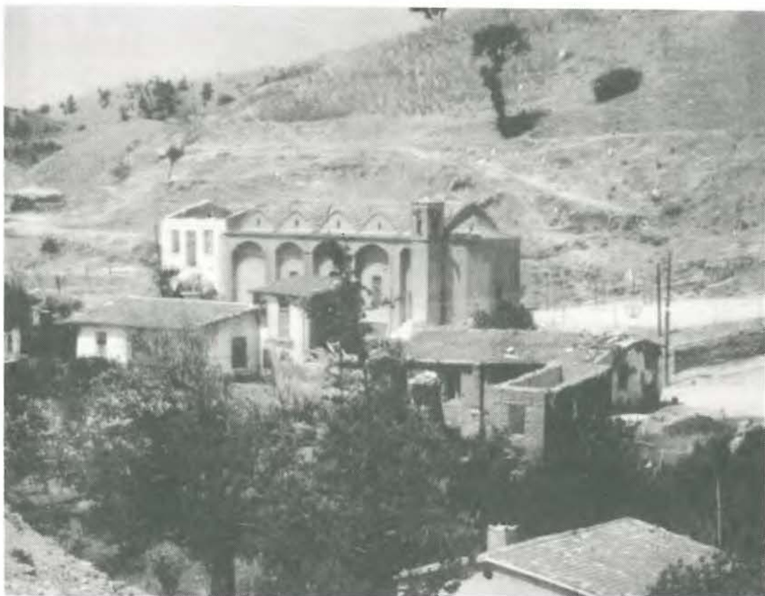
Η εκκλησία της Αγίας Άννας στη Συρκανιά

ΧΡΟΝΙΑ 15η ΜΑΗΣ - ΔΕΚΕΜΒΡΗΣ 1992 Αρ. ΤΕΥΧΟΥΣ 44-45