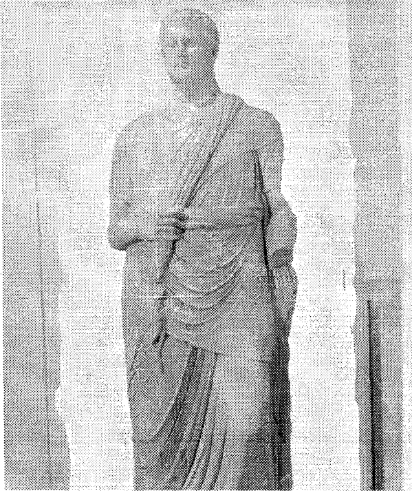
Άγαλμα Πτολεμαίου άρχοντος που βρέθηκε στο Ιερό του Απόλλωνα στη Βώνη