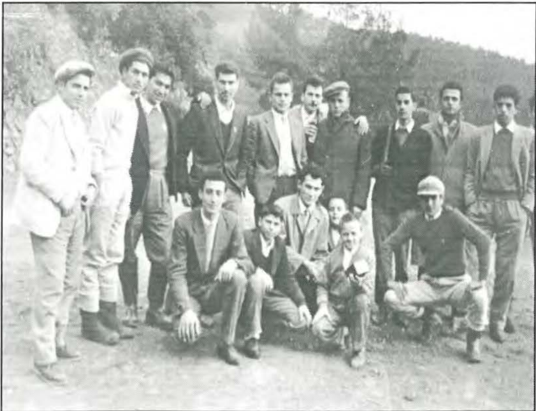
Μέλη του ΠΑΟΚ Κυθρέας σε εκδρομή τους στα χιόνια Τροόδους το έτος 1962