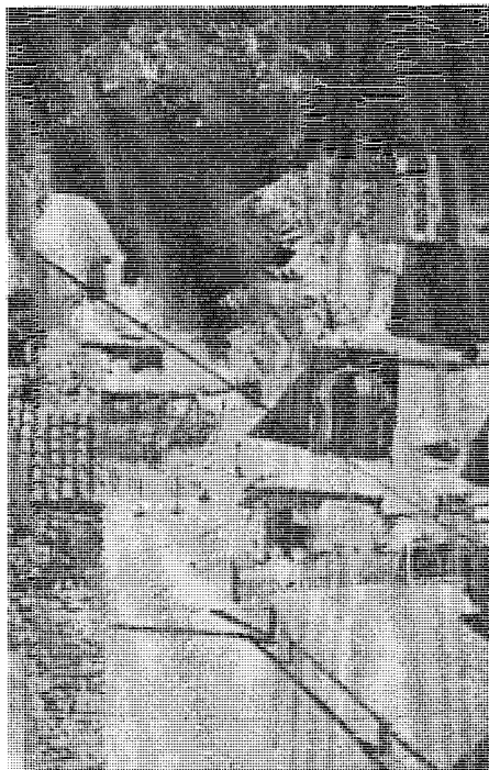
Δεξιά στην Αργυρούπολη: Η Παναγία Σουμέλα