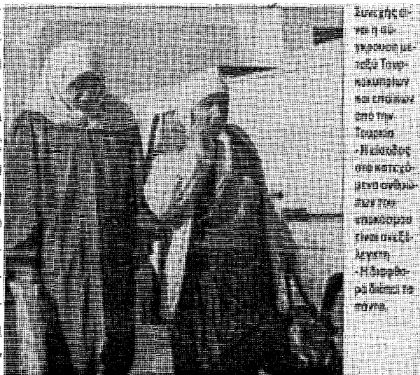
Επιπλέον είναι η επι- γνώση με- ταξύ των κακωχητών και σπυριών στην Τεραρία - Η εισαγωγή στη κατε- χόμενα ανθρω- πών που επισκευάζει είναι ανεξέ- λεγκτη - Η διαφθο- ρά διακινεί το πένθος

δικαιωμάτων όλων των Κυπρίων από τις αστυνομίες των component states, του «common state» («κοινό κράτος») και της «Κοινής Υπηρεσίας Ερευνών». Επίσης, είναι οφθαλμοφανές ότι το σχέδιο Ανάν δεν προβλέπει μια υπηρεσία πληροφοριών για το «κοινό κράτος». Ουσιαστικά, το υφιστάμενο σχέδιο Ανάν (α) αποτυγχάνει να εξασφαλίσει την ασφάλεια του προβλεπόμενου «κοινού κράτους» από ποικίλους εσωτερικούς και εξωτερικούς κινδύνους (π.χ. εξτρεμιστικά στοιχεία των οποίων τα συμφέροντα θα θιγούν από μια λύση του Κυπριακού) και (β) προβλέπει αστυνομίες που μάλλον δεν θα είναι σε θέση να αντιμετωπίσουν αποτελεσματικά το σοβαρό έγκλημα στην Κύπρο μετά την λύση. Ας έχουν γνώση οι φύλακες.