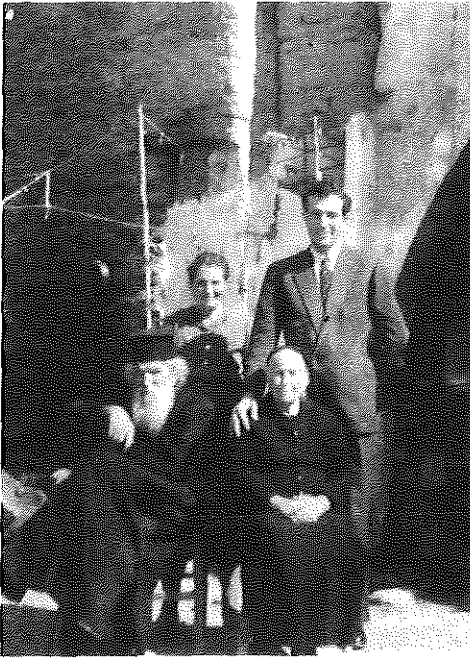
Η Οικογένεια του Παπάμακρη

ένας αιώνας, έλεγε ο εύεληπς νέος! Όρθρος βαθύς, πρωί-πρωί προτού να λαλήσει ο πετεινός, με το μουλήρι ξεκίνησε για την Λευκωσίαν. Πρέπει να συμβουλευτεί τον Αρχιεπίσκοπον. Τα έβαλαν όλα κάτω, τα ανέλυσαν, δεν εύρισκε αρνητικά ο Αρχιεπίσκοπος και συμβούλευσε τον αγαπητόν του ιερέα να πει το μεγάλο ναι, θέτοντας ένα μόνο όρον, να μείνει στην Κύπρον ο νέος μετά τον γάμον, να δραστηριοποιηθή στον τόπον του, το λαμπρό, το άξιο παληκάρι. Τον χρειάζεται ο τόπος του, του μήνυσε ο Αρχιεπίσκοπος, και τον προσκάησε στο Επισκοπεϊό.