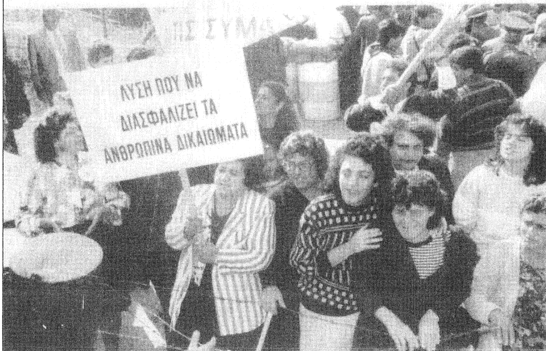
Από την πορεία προς την περιοχή Μια Μηλιάς - Κυθρέας που έγινε στις 3 Νοεμβρίου 1991.

ΧΡΟΝΙΑ 14η ΜΑΗΣ-ΔΕΚΕΜΒΡΗΣ 1991 Αρ. ΤΕΥΧΟΥΣ 41-42